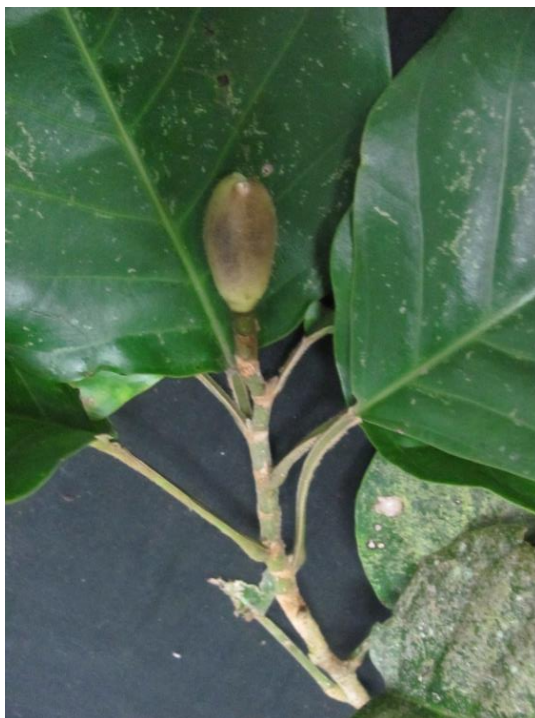
Ilustración 3 Muestra recolectada para el Herbario CDMB

Se recolectó material para el Herbario CDMB, y se realizó el proceso de herborización correspondiente.