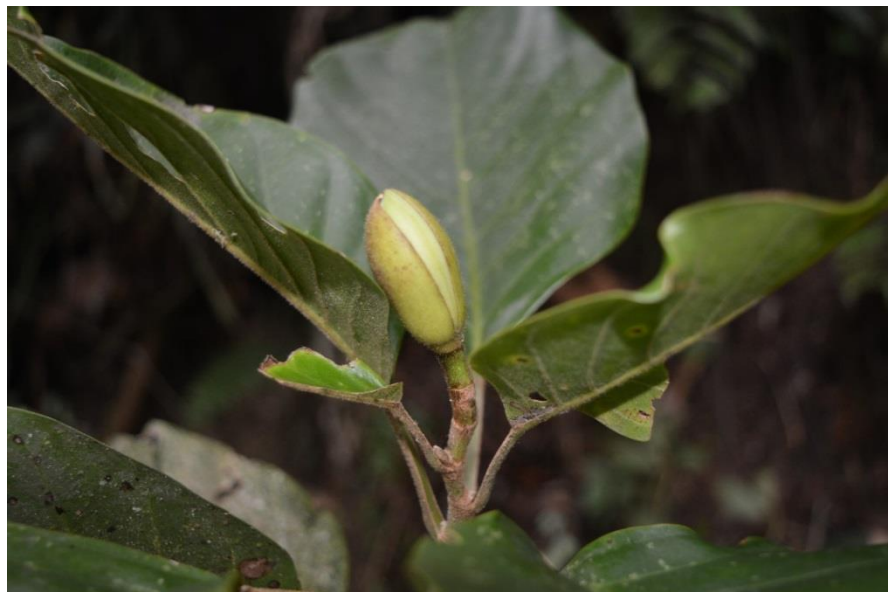
Botón floral de Magnolia santanderiana .