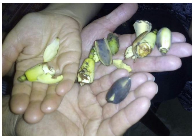
Ilustración 5 Foto de botones florales de Magnolia Santanderiana , recolectados en la hojarasca