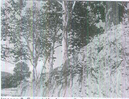
Imagen 3. Exposición área radicular de los individuos.