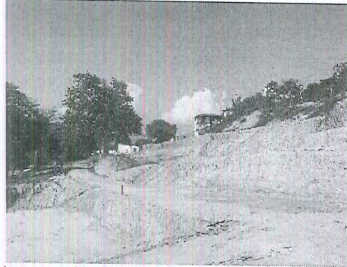
Imagen 4. Movimiento de tierra realizado en el predio.