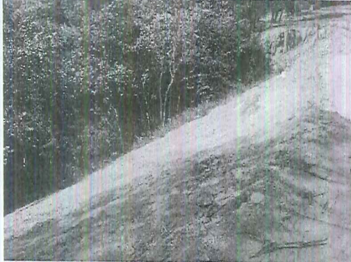
Imagen 5. Disposición de material en el talud.