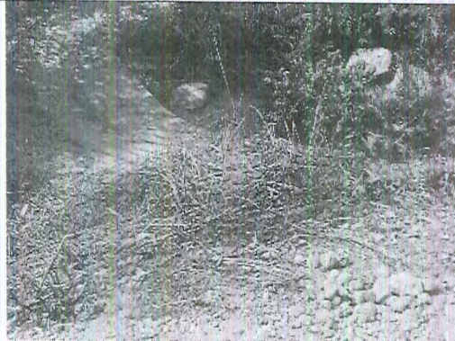
Imagen 7. Quema focalizada.