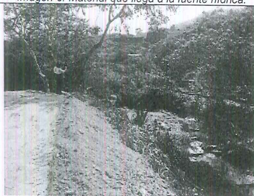
Imagen 8. Material que llega a la fuente hídrica.