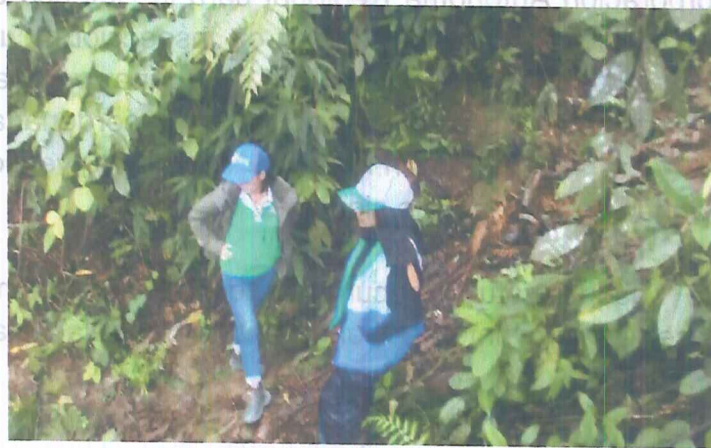
Fotografía 3. Bosque natural secundario