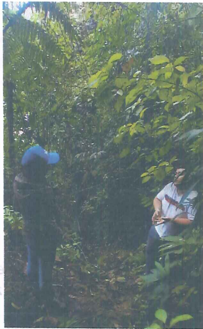
Fotografía 1. Bosque natural secundario