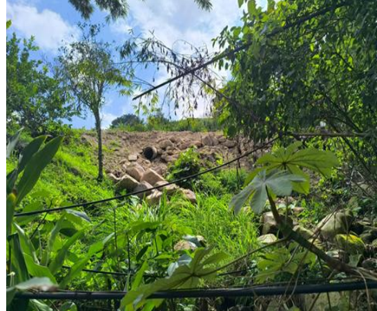
Fotografía 8. Retiro de material suelo y proceso de revegetalización.