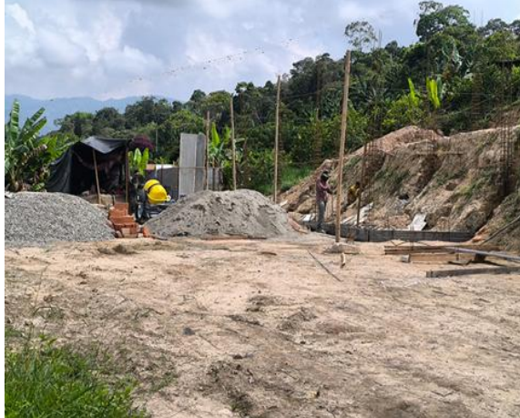
Fotografía 7. Proceso de construcción