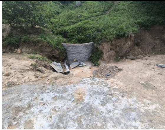
Fotografía 6. Adecuación para paso de aguas escorrentidas