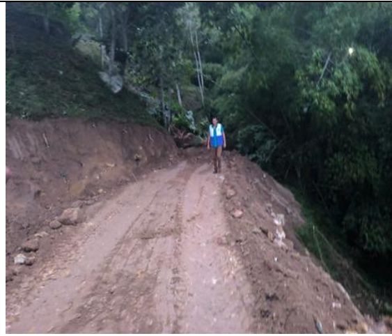
Fotografía 4. Adecuación del terreno con maquinaria amarilla

En concordancia con lo identificado en campo, se procedió a realizar requerimiento en el sitio, en primera medida haciendo retiro inmediato de maquinaria, toda vez que no se aportó ningún documento de legalidad para las actividades.