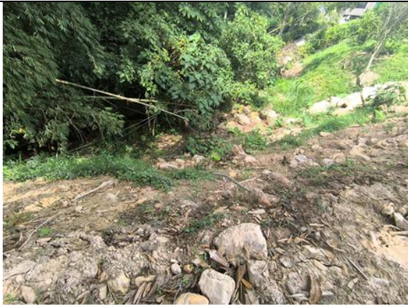
Fotografía 5. Retiro de material RCD dispuesto en el talud