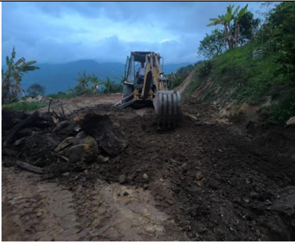
Fotografía 3. Adecuación del terreno con maquinaria amarilla